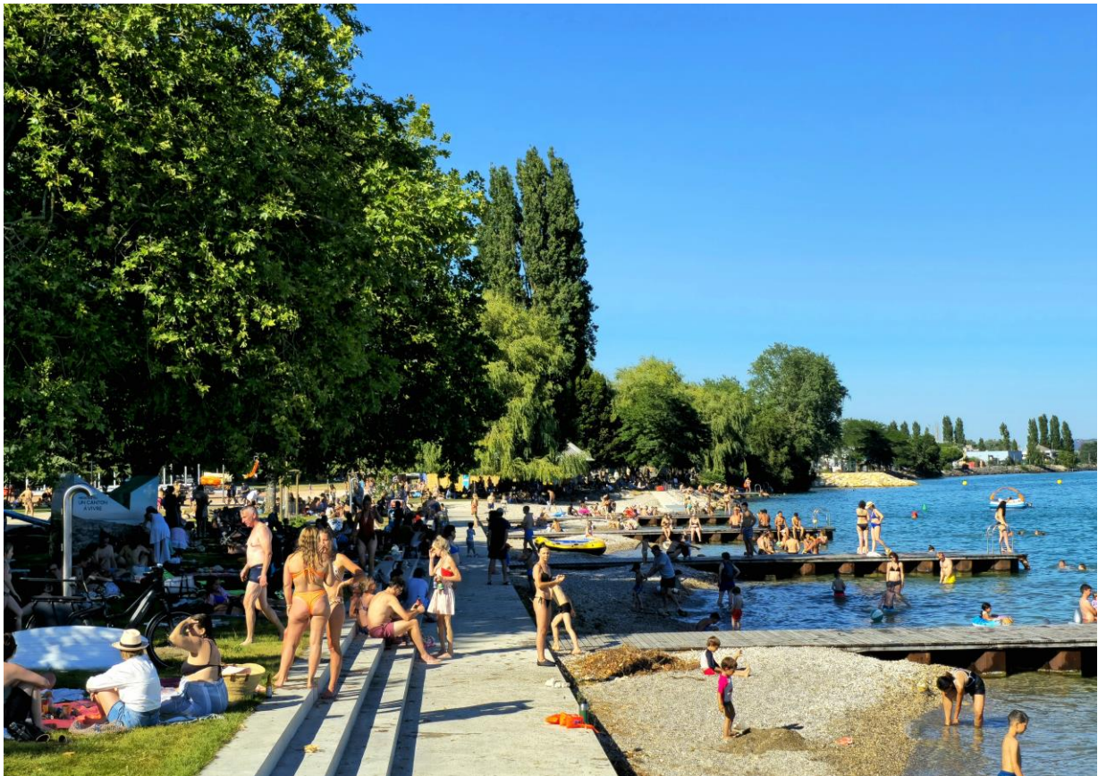
Image : rives et accès à l'eau.

Concours d'intervention artistique, procédure sélective en 2 phases Phase 1 : Cahier de sélection, appel à candidatures