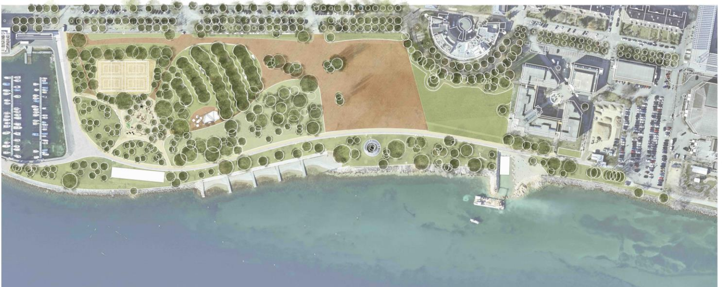
Image : Plan final des aménagements prévus.

Une scène polyvalente servira à accueillir spectacles et activités culturelles. Elle sera couverte par une structure légère et démontable, qui répondra également au besoin d'un abri pour les courses d'écoles et autres évènements scolaires.