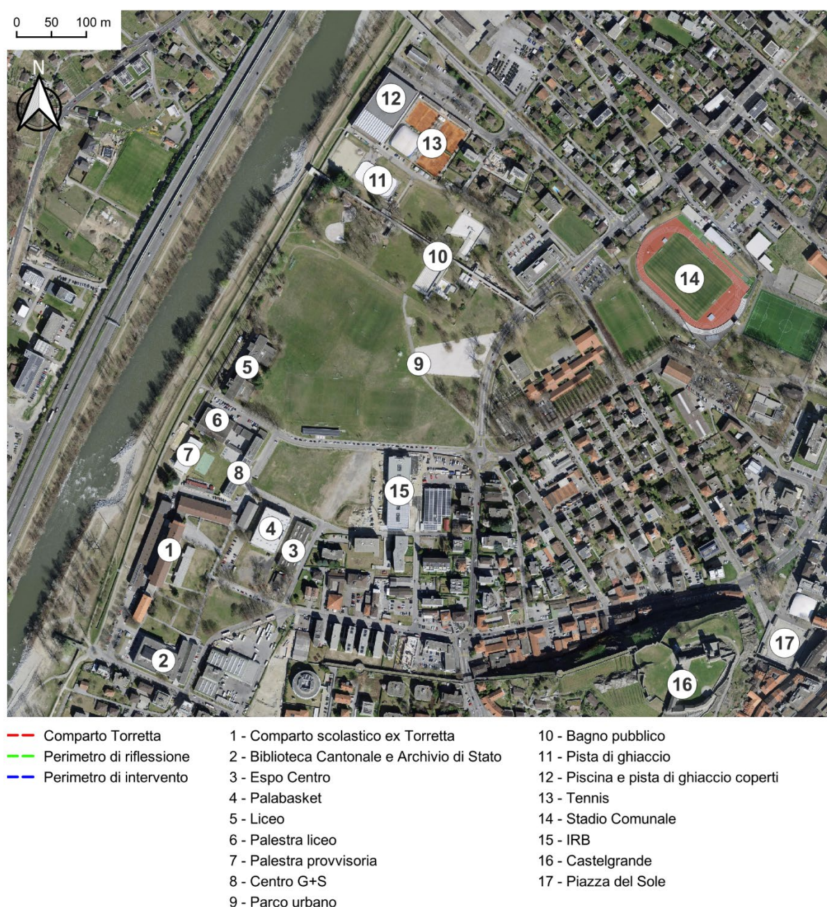
Figura 1: Contesto generale

All’interno di questa cornice di sviluppo, si inserisce il progetto per una nuova palestra tripla. Il sito selezionato, oggetto di approfonditi studi preliminari, permetterà di consolidare ulteriormente la vocazione del comparto come polo formativo, sportivo e di innovazione, capace di sostenere una crescente domanda di servizi per la comunità e di valorizzare al contempo il contesto ambientale unico dell’area, in sinergia con altri progetti di riqualificazione.