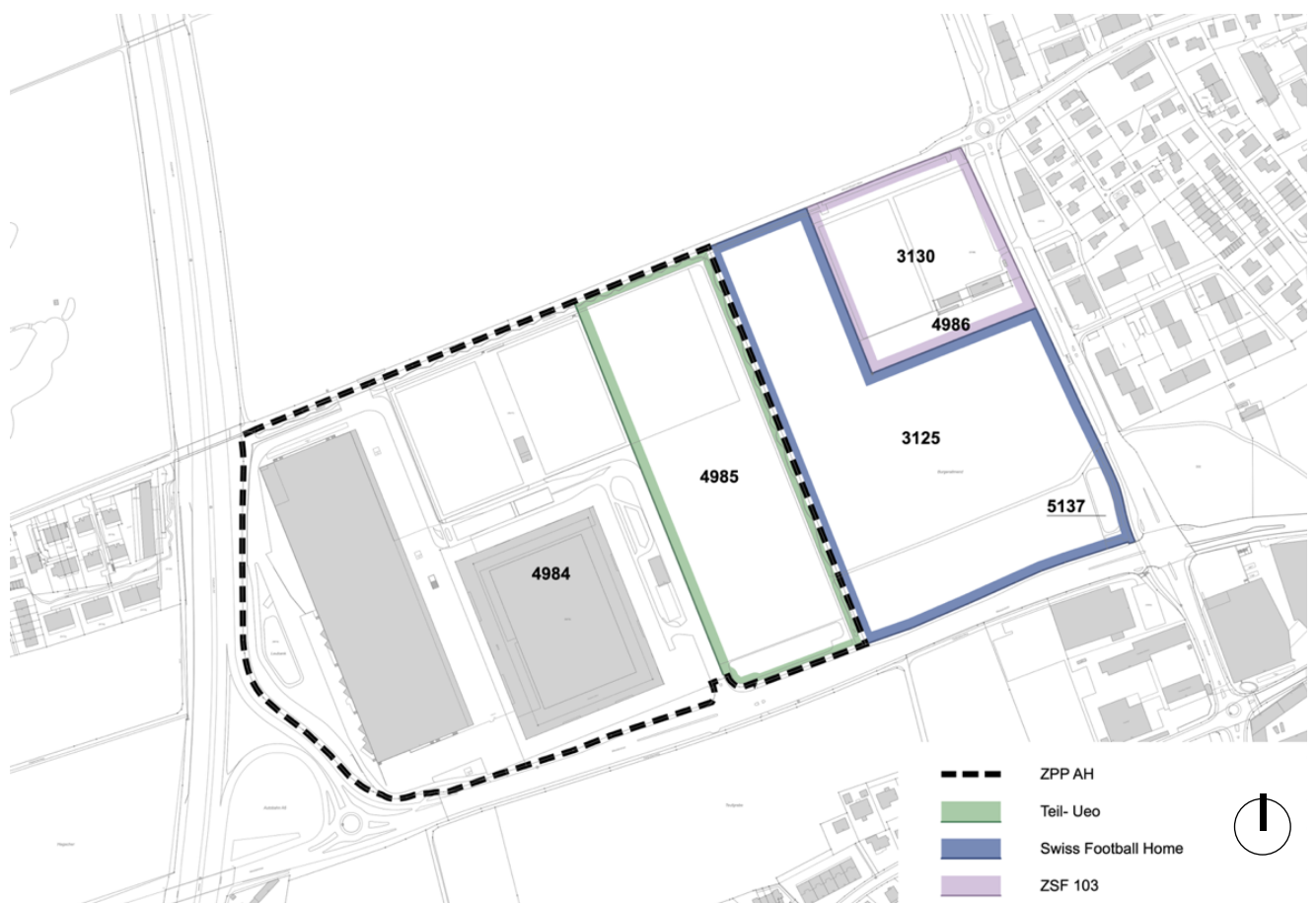
Abb. 4 Überblick Arealteile im Sport- und Freizeitcluster Thun