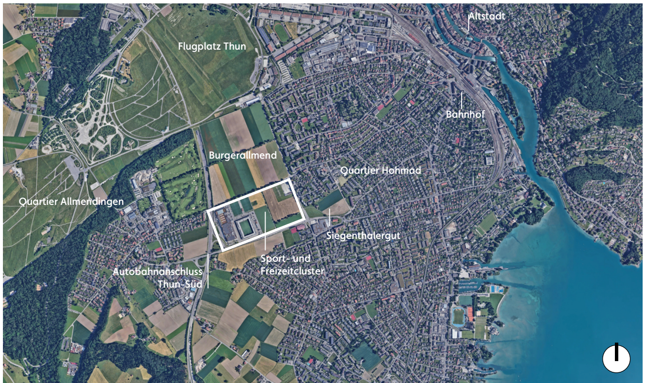
Abb. 1 Luftbild Stadt Thun

Das Planungsgebiet «Sport- und Freizeitcluster Thun» liegt im Westen der Stadt, eingebettet in einen landwirtschaftlich geprägten Gürtel, der das Siedlungsgebiet abgrenzt. Es befindet sich zwischen den Quartieren Allmendingen und Hohmad. Der Sport- und Freizeitcluster umfasst bereits bestehende Sport- und Freizeiteinrichtungen sowie die östlich davon gelegenen Felder zwischen der Autobahn und der Bürgerstrasse sowie zwischen Weststrasse und Allmendingen-Allee. Das Gebiet ist mit dem Autobahnanschluss Thun-Süd in unmittelbarer Nähe bestens an das Nationale Strassennetz angeschlossen.