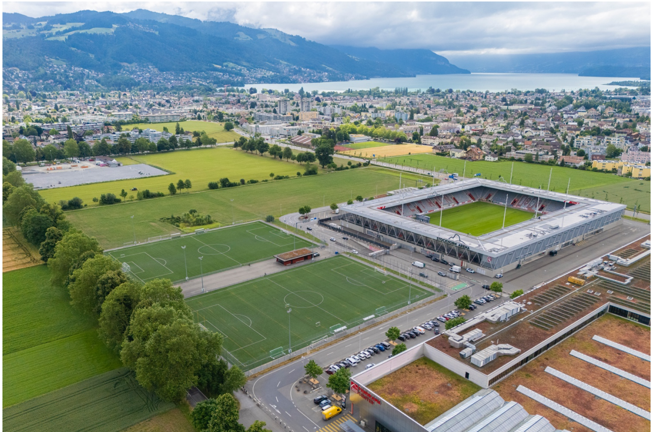
Abb. 3 Blick Richtung Süden: im Vordergrund das Panorama- Center und die Stockhornarena