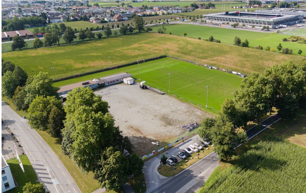
Abb. 2 Blick Richtung Westen: Im Vorder- grund die Zone für Sport und Freizeit ZSF 103, in der Mitte des Bildes der Peri- meter für das Swiss Football Home