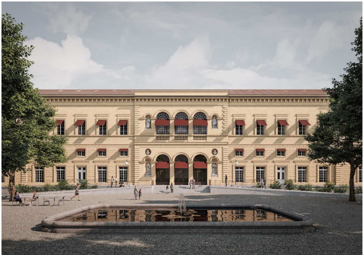
Figure 1 : Façade Sud du Collège latin. Crédits : Noue Studio, Bureau Chablais-Fischer

Concours d'intervention artistique, procédure sélective en 2 phases Phase 1 : cahier de sélection, appel à candidatures