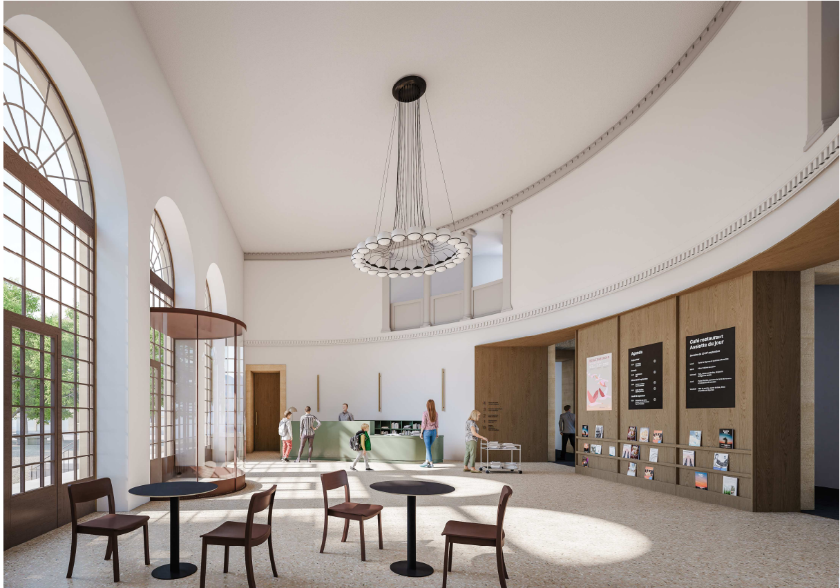
Figure 2 : café-restaurant au rez-de-chaussée. Crédits : Noue Studio, Bureau Chablais-Fischer