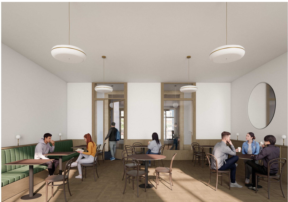
Figure 3 : café-restaurant au rez-de-chaussée. Crédits : Noue Studio, Bureau Chablais-Fischer