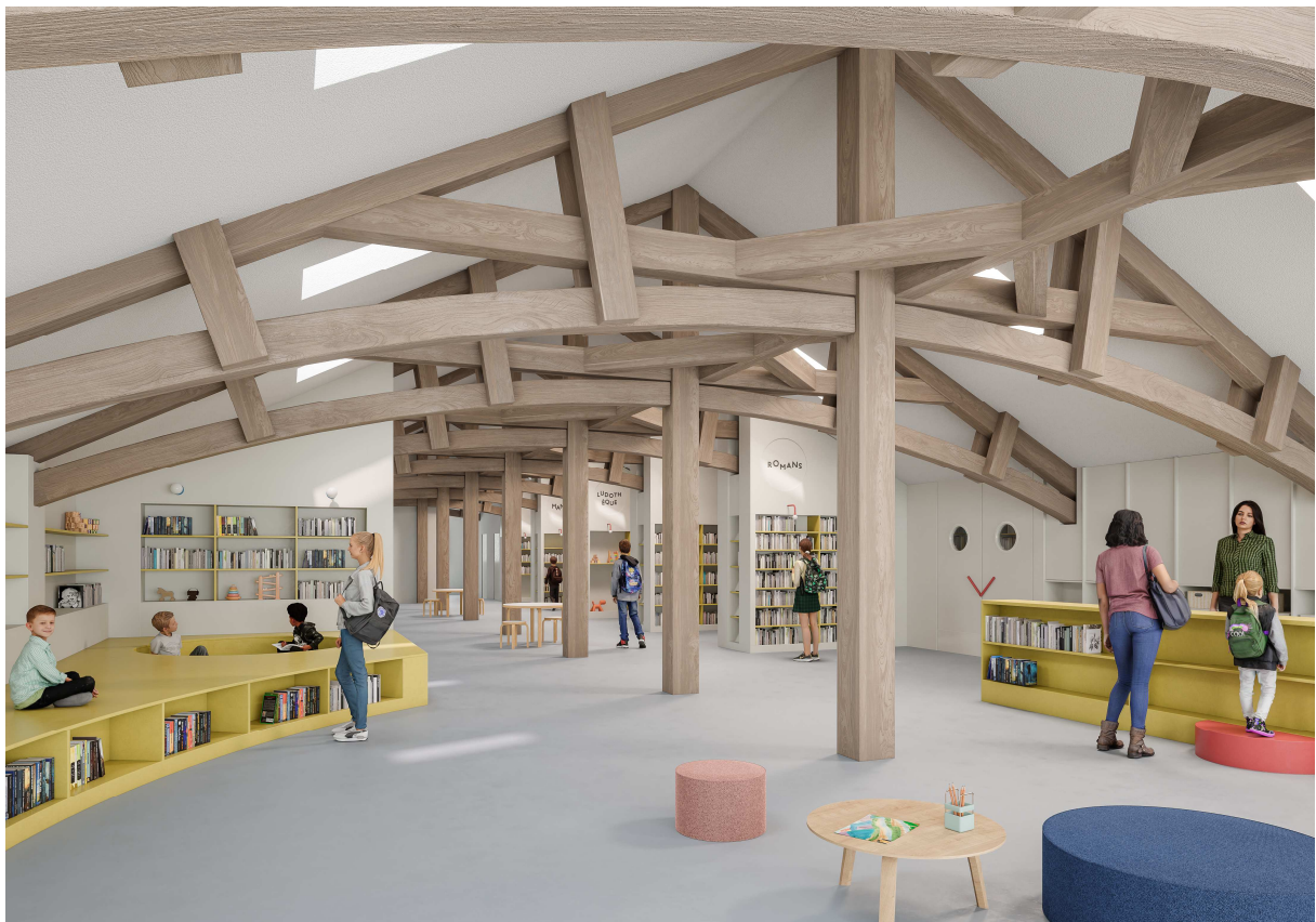
Figure 3 : Espace Jeunesse, les combles.

Le projet renforce la place du Collège latin comme repère dans le tissu urbain neuchâtelois. En restaurant son rayonnement architectural, tout en lui conférant une nouvelle vocation culturelle ouverte, il réconcilie mémoire patrimoniale et dynamique contemporaine. L'intervention respecte les lignes de force du bâtiment historique, tout en favorisant la transparence, la lumière et la fluidité dans l'usage.