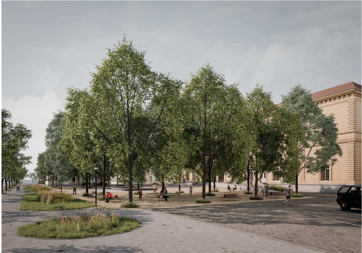
Figure 4 : Place Agota Kristof.