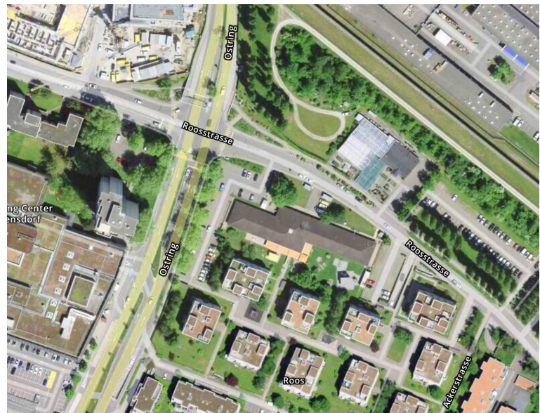
Abbildung 3: Luftaufnahme Parzelle Kat. Nr. 9413