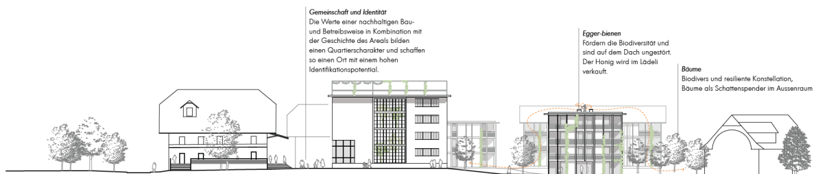
Abb. 5 Impressionen Projekt Team Brügger Architekten AG, Poster und Modell in Beilage 3