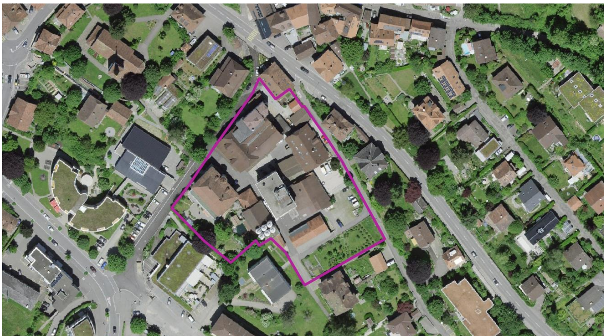
Abb. 1 Planungsperimeter

Für die Bearbeitung in der Präqualifikation wurde die Aufgabenstellung offen formuliert. Erwartet wurde eine Ortsanalyse mit städtebaulicher Auseinandersetzung und eine Volumen- und Nutzungsstudie für den Planungsperimeter. Als Ergebnisse beurteilt wurden die pro Team abgegebenen drei Poster, das Modell im Massstab 1:500 und der Auftritt/Präsentation.