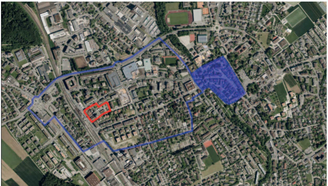
Abbildung: Lage des Studienauftragsperimeters (rot) Bahnhofstrasse Süd in Sursee. Blau eingefärbt die Altstadt, blau umrandet die sogenannte „Isebahn Vorstadt“.

Das Mehrfamilienhaus an der Bahnhofstrasse 45 mit Gewerbeflächen wurde 1905 als städtischer Repräsentationsbau erstellt, ist als erhaltenswert eingestuft und befindet sich im Besitz der Estermann Immobilien AG.