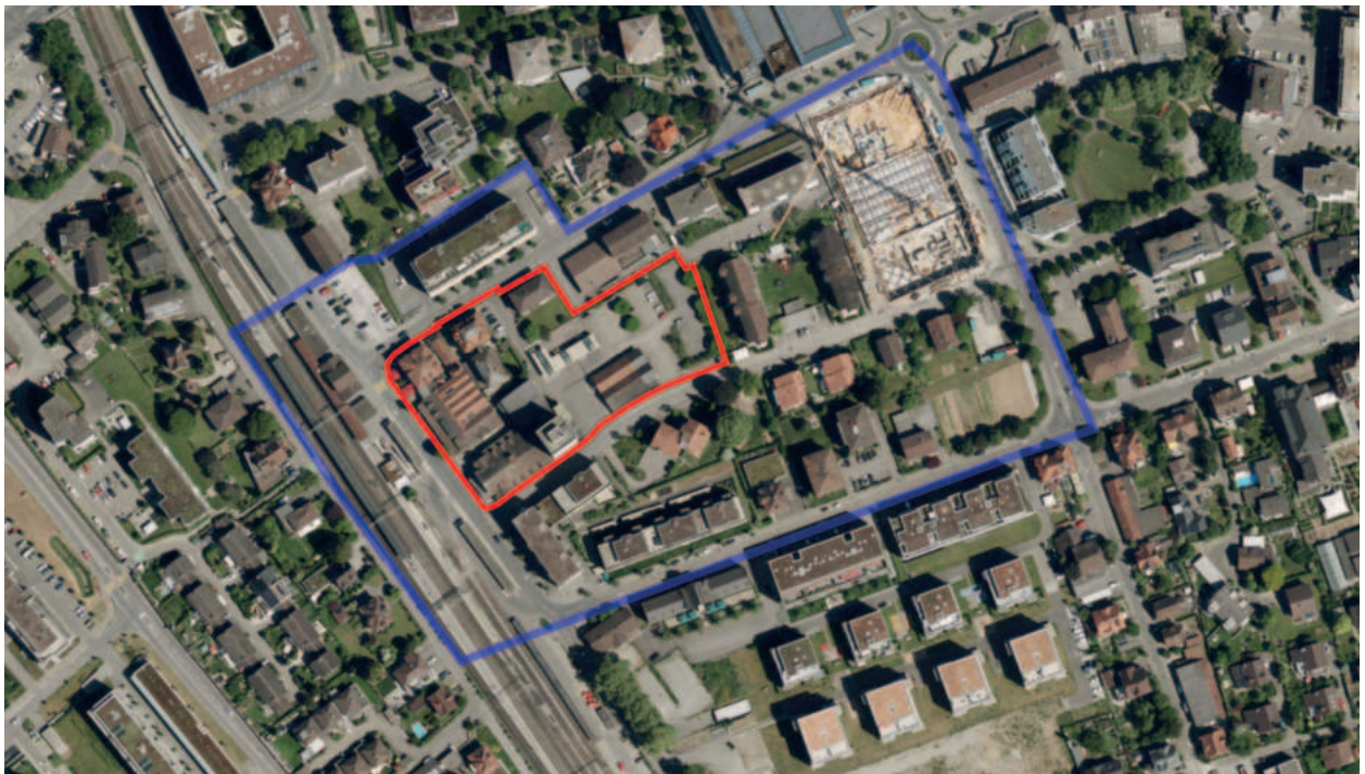
Abbildung: Der Bearbeitungsperimeter (rot) umfasst die Parzellen der Grundeigentümerschaften, der Betrachtungsperimeter den Bereich zwischen Bahnhofstrasse, Christoph-Schnyder-Strasse, Schnydermatt und Bahnhofplatz.