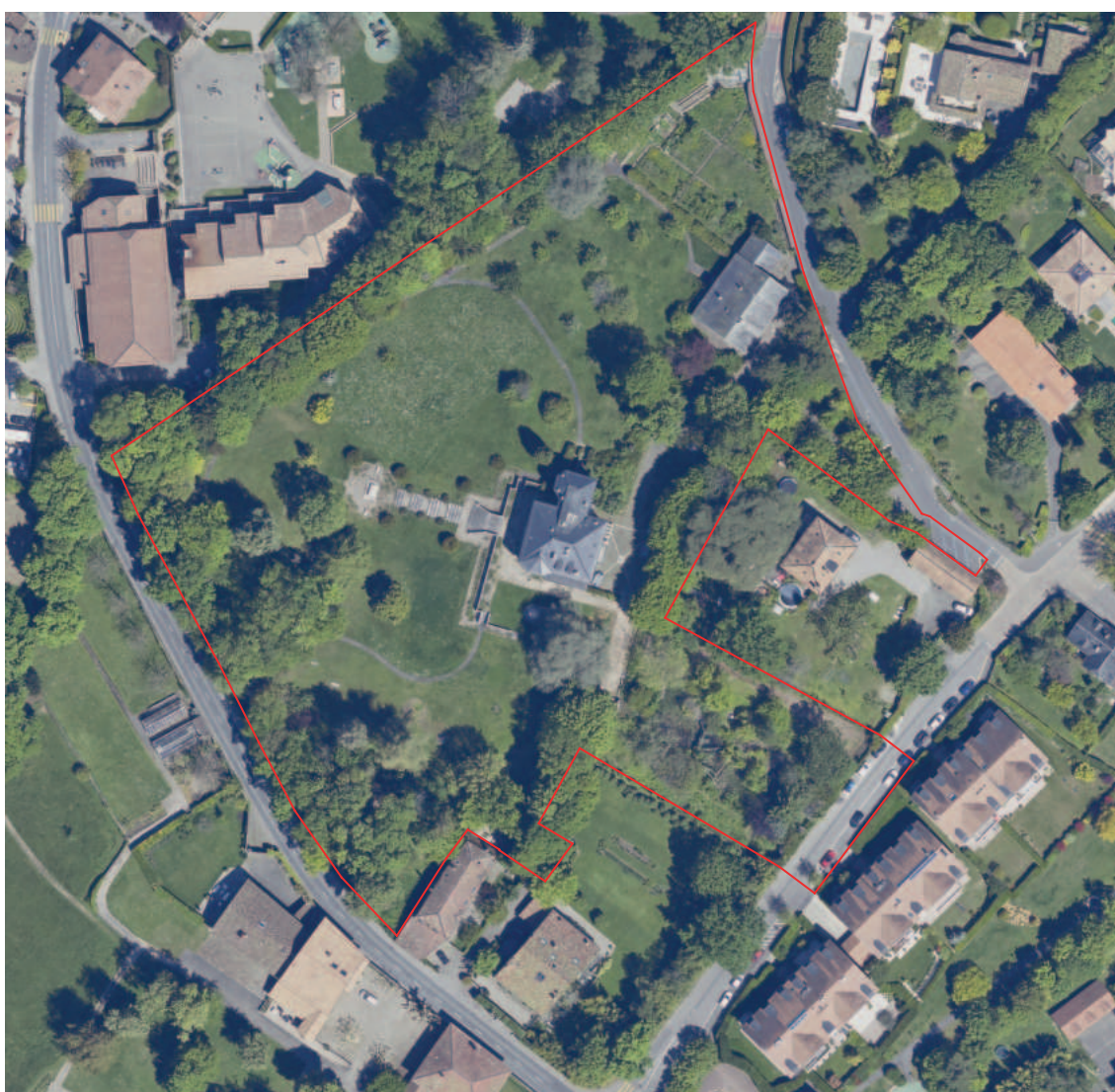
Illustration : Parc des Fours

À l'issu d'une réflexion approfondie, les autorités communales décident en 2021 de réorienter le programme du projet. L'idée conductrice est de pouvoir réaliser un ensemble destiné à recevoir des équipements publics pour la jeunesse. Le dessein de la commune est double, d'une part mettre à disposition une offre diversifiée d'équipements publics en prolongation de l'école du Manoir et d'autre part mettre en valeur le parc des Fours et son écrin de verdure. Elles décident alors d'entreprendre une consultation sous la forme d'un concours visant à préserver et conserver l'environnement physique du site des Fours.