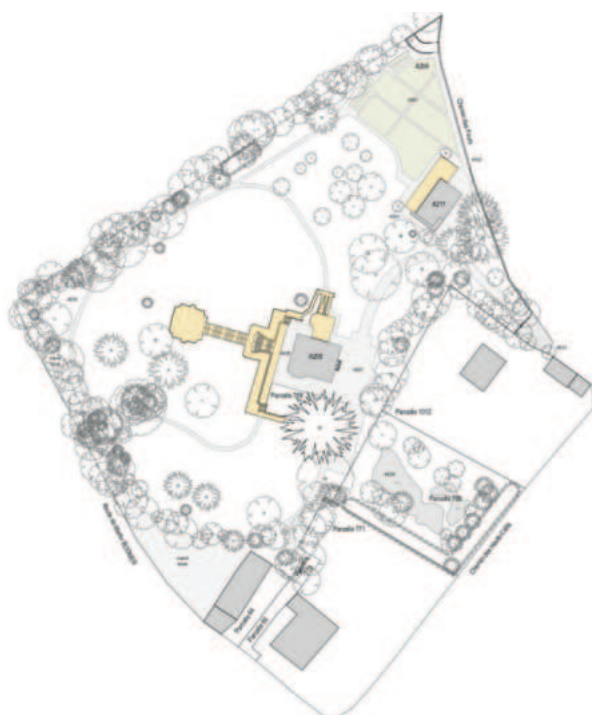
Illustration : Synthèse inventaire Qualité-Source 2018

Un inventaire des qualités patrimoniales de la parcelle a été effectué après une consultation de l'office du patrimoine et des sites en 2018, qui a permis de déterminer l'approche adéquate en termes de conservation. Il a visé notamment à identifier la valeur individuelle et de composition de chaque élément construit sur la parcelle n°768. En effet, cet inventaire qualité a été ponctué par une évaluation qui a permis de définir précisément ce qui doit faire l'objet d'une conservation impérative de ce qui pourrait faire l'objet d'une démolition. Autorités cantonales et communales ont de cette manière tracé la ligne directrice et l'approche à mettre en œuvre en termes de conservation du patrimoine de la parcelle. La serre à l'angle Nord de la parcelle doit être conservée ainsi que les murs de limite parcellaire ; elle est actuellement utilisée dans le cadre de l'exploitation des jardins potagers. Il n'est pas attendu de projet pour la serre dans le cadre de ce concours.