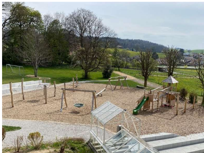
Jeux actuels de la place de jeux n° C