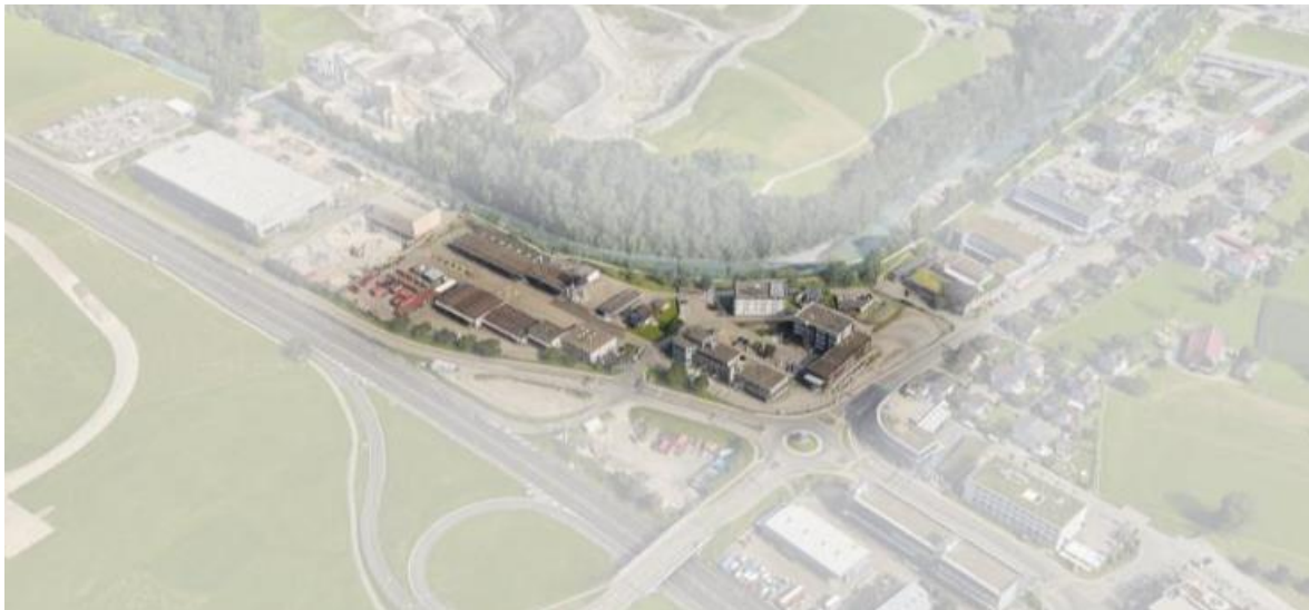
Situation Kreuzstrassenareal mit Perimeter

Erstellung durch Fux+Partner GmbH, Glorihöchi 15, 6403 Küssnacht am Rigi Genehmigt am 1. Februar 2024 durch Beurteilungsgremium