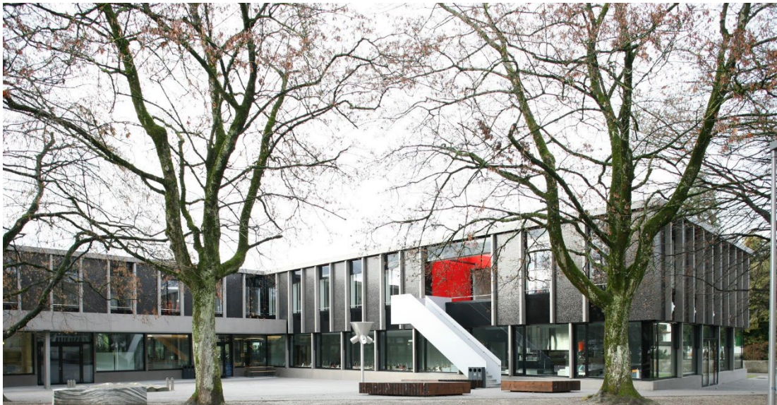
Aussenansicht / Pausenhof

Die zweiseitig belichteten Unterrichtsräume sind jeweils um ein gemeinsames Pausenfoyer organisiert, das sich zu einem Freiluftzimmer orientiert. Es entsteht ein kollektiver Universalraum, der die Möglichkeit eröffnet auch ausserhalb des Klassenzimmers zu lehren und zu lernen. - Er bietet Platz, um bespielt zu werden. Das Freiluftzimmer, ein windgeschützter Aussenraum, erzeugt einen Lichtwandel über den ganzen Tag hinweg und gibt den Ausblick in die Landschaft frei. Ein Treppenlauf führt auf direktem Wege zu den vielfältigen Spiel- und Pausenbereichen im Erdgeschoss.