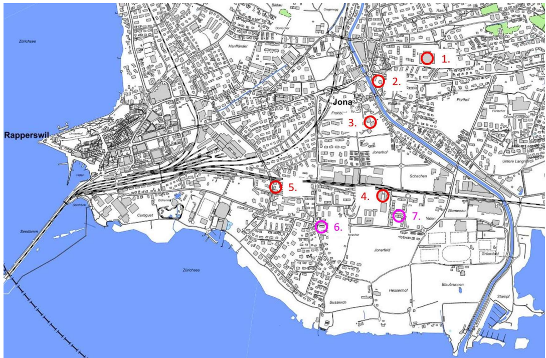
1. PS Bollwies, 2. PS Dorf, 3. PS Schachen, 4. PS Weiden, 5. PS Südquartier, 6. KG Busskirch, 7. Quartier-KG Weiden