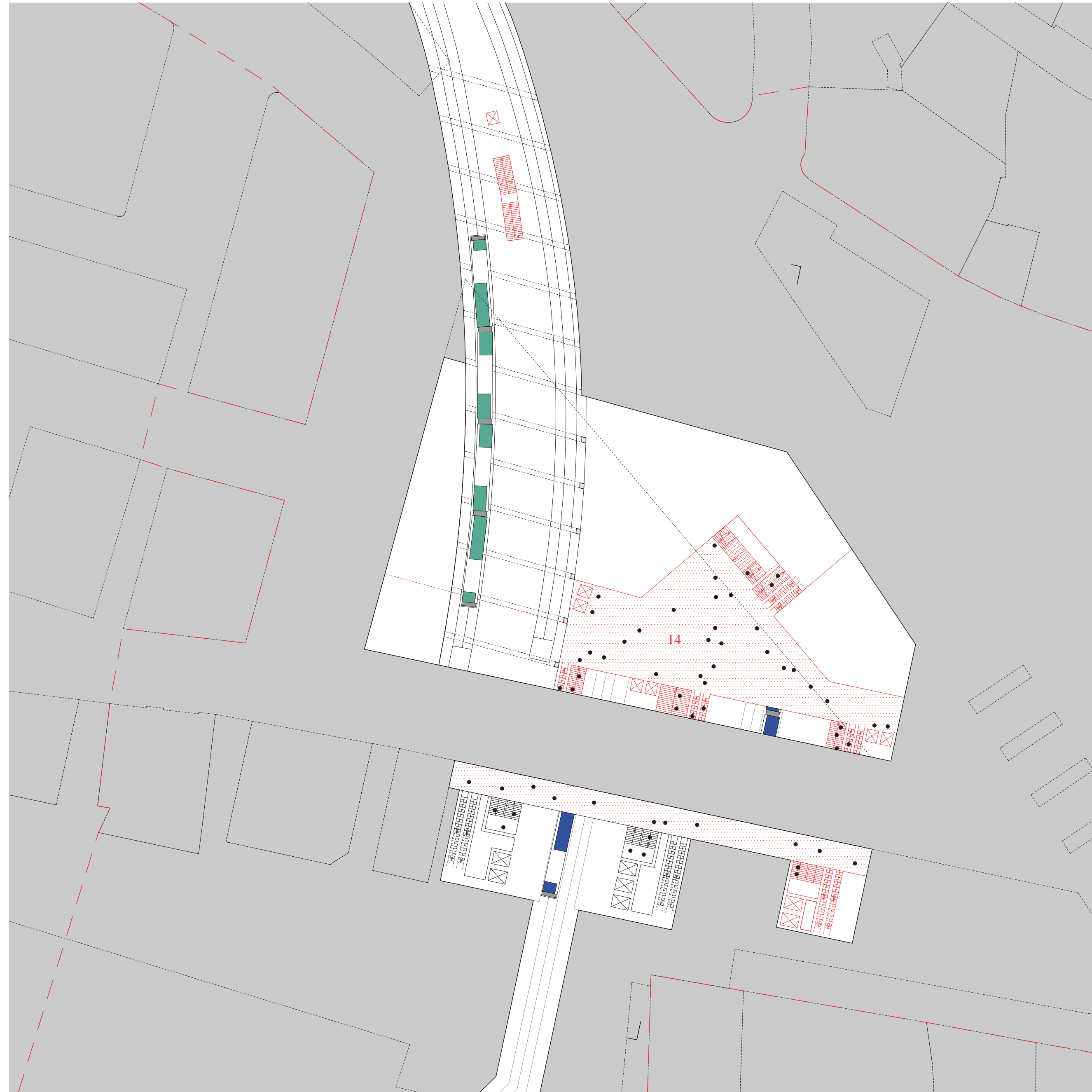
Plan, Mezzanine, 1:500