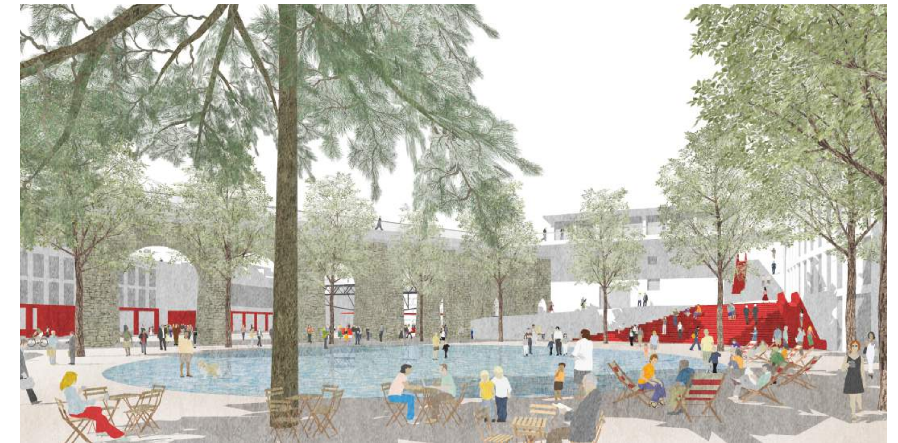
Vue perspective, Place Centrale

La configuration en strates – historiques et morphologiques – de la Ville de Lausanne appelle à une lecture attentive des lieux et aux solutions subtiles, permettant d'intégrer des contraintes, des histoires et des usages multiples. À l'opposé du grand geste iconique, le projet inclut une série d'interventions contextuelles, ponctuelles et précises. Son objectif est de fluidifier, de simplifier et de rendre lisible l'espace urbain.