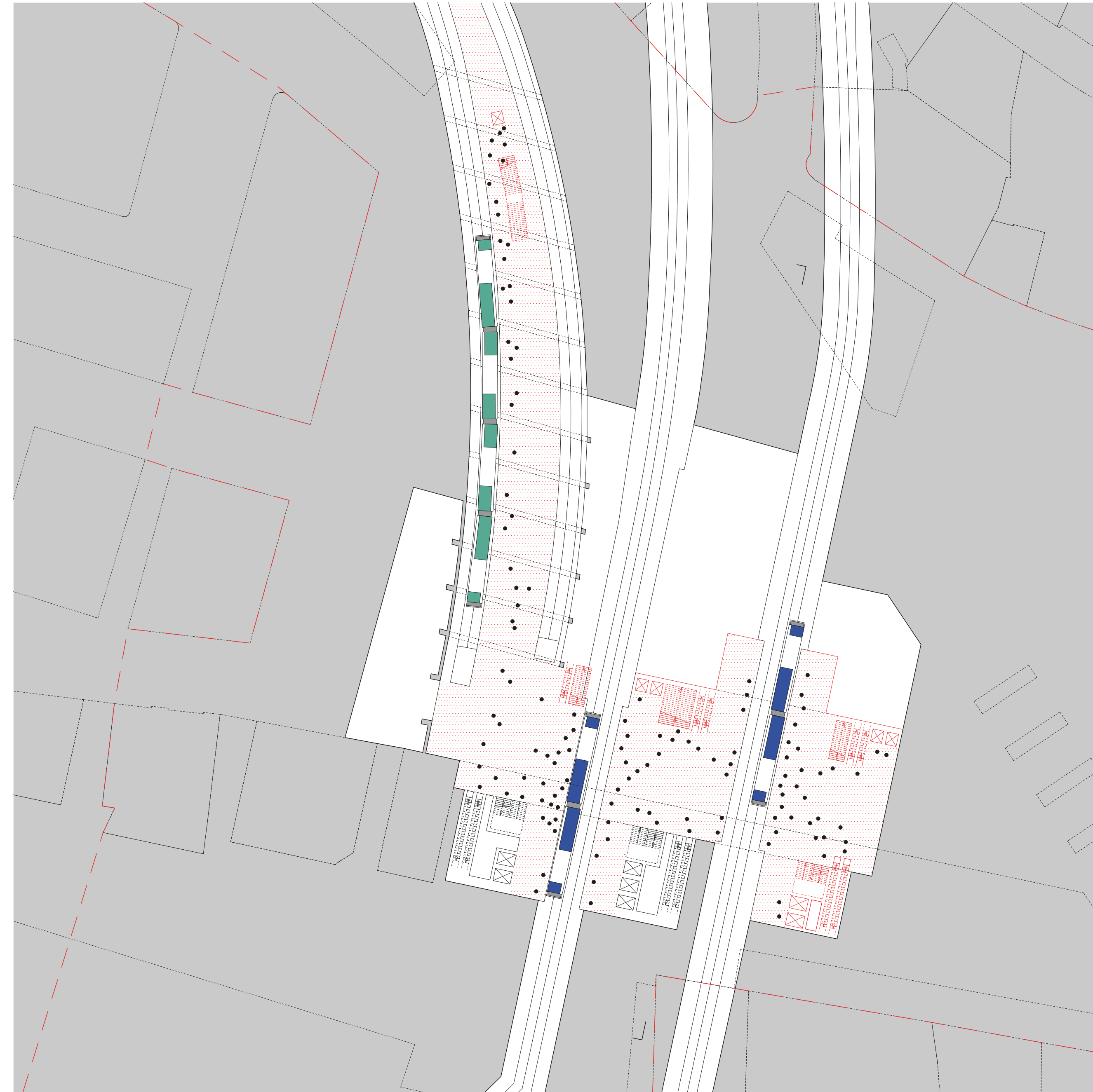
Plan, Quais, 1:500