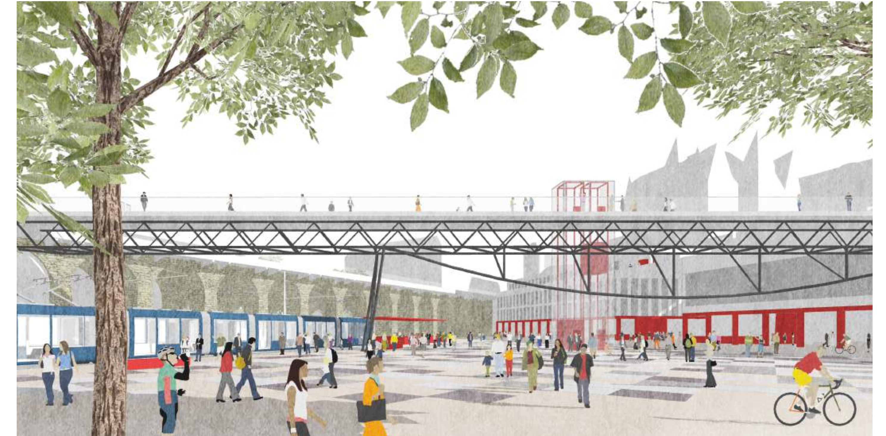
Vue perspective, Place de l'Europe