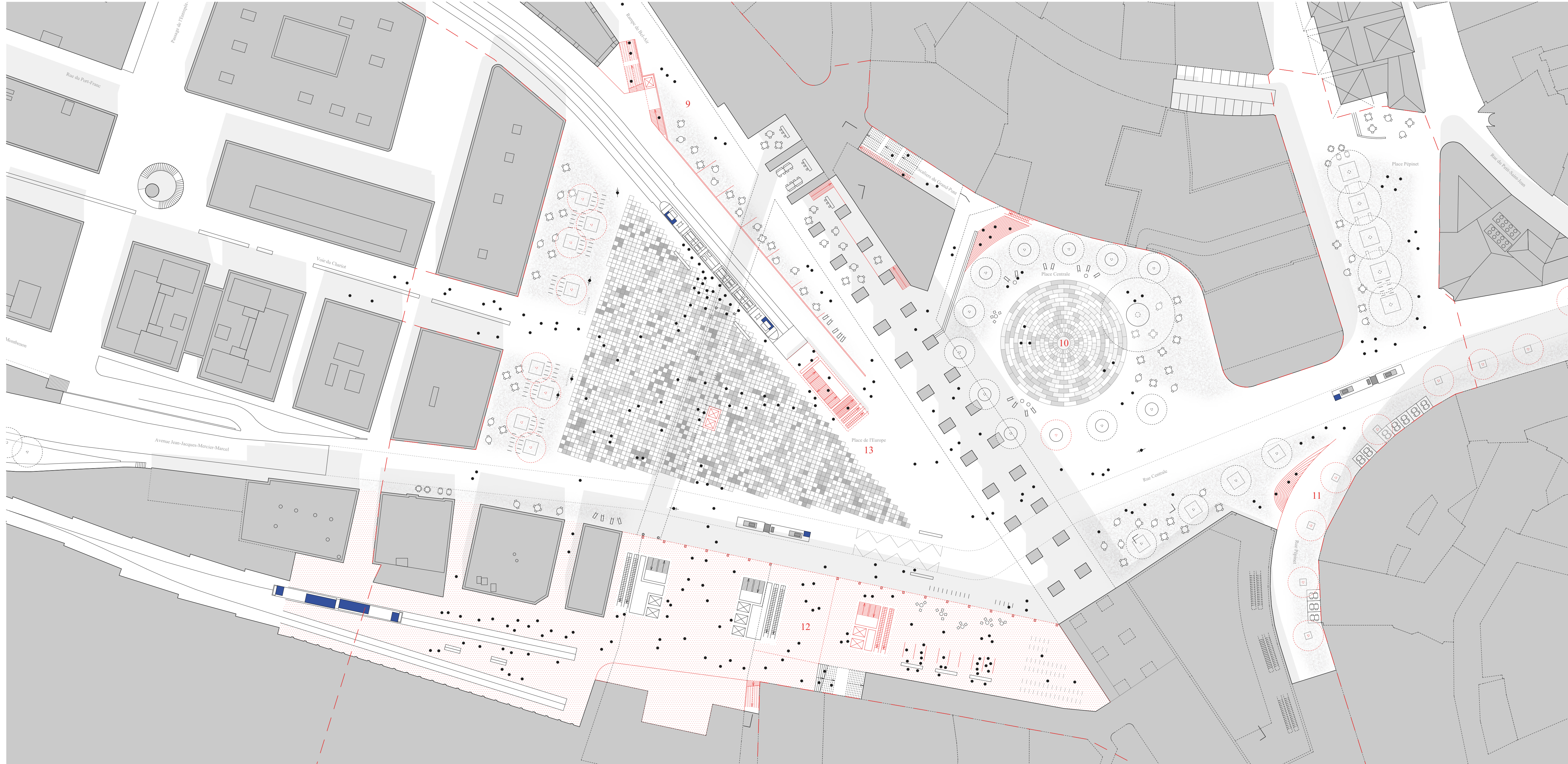
Plan, Ville basse, 1:500