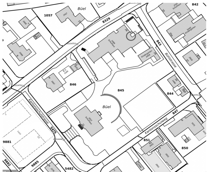
Abbildung 2: Parzelle Kat. Nr. 845