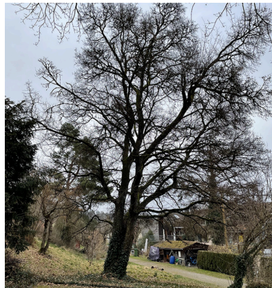
3: Feldahorn ( Acer campestre ) Schützenswert, sehr vital