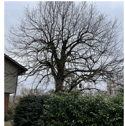
2: Winterlinde ( Tilia cordata ) Erhaltenswert, Vitalität fraglich