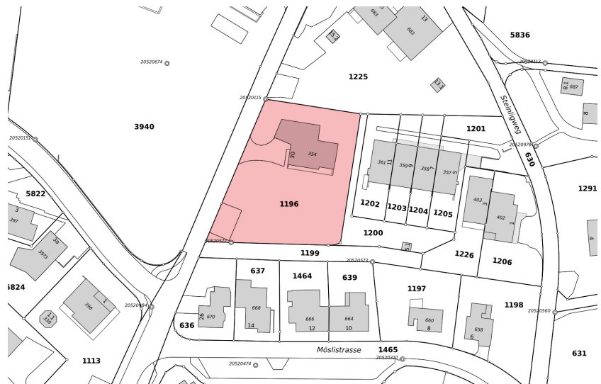
Orthofoto Parzelle Kat. Nr. 1196