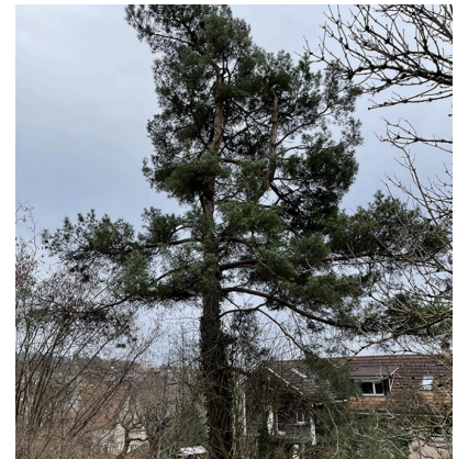
4: Waldföhre ( Pinus sylvestris ) Erhaltenswert, sehr vital