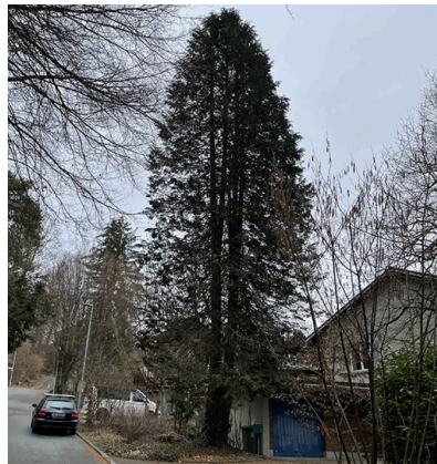
1: Lebensbaum ( Thuja occidentalis ) Erhaltenswert, vital