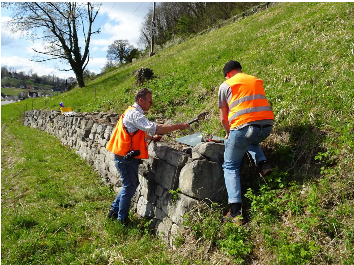
Abbildung. 4: Nachweis Schlingnatter, Projektkoordination mit SBB und Freiwilligen

Der Vertragsentwurf sowie die Honorarofferte dienen als Basis für die Ausschaffung des Vertrages. Mit der Einreichung eines Angebots wird der beiliegende Vertragsentwurf als Grundlage für einen allfälligen Vertragsabschluss akzeptiert.