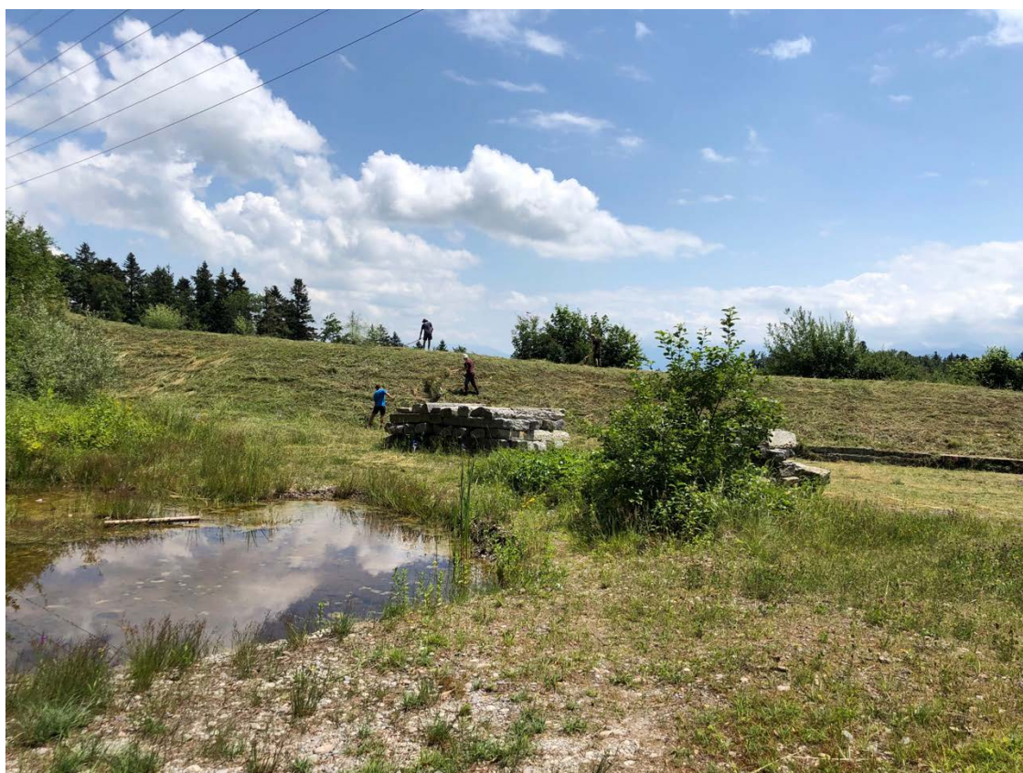
Abbildung. 3: Fertigstellung Weiher und Anpflanzungen Trockenwiesenpflanzen