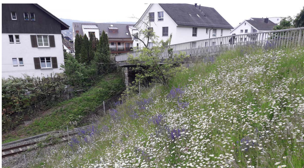
Abbildung. 2: Siedlungsökologie: Insektenförderung