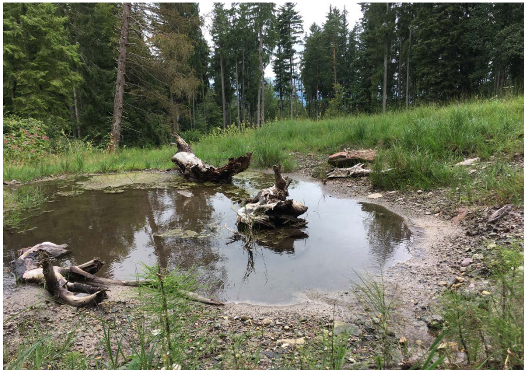
Abbildung 1: Neue Weiher als wertvoller Lebensraum für bedrohte Amphibien

Gestützt auf das Bundesgesetz über den Natur- und Heimatschutz, das kantonale Naturschutz-Gesamtkonzept und Festlegungen zur ökologischen Vernetzung im Regionalen Richtplan, konzipiert, plant und realisiert das Naturnetz Pfannenstil (NNP) im Auftrag der Planungsgruppe Pfannenstil Massnahmen zur Erhaltung und Förderung von Flora und Fauna sowie den entsprechenden Lebensräumen. Gleichzeitig trägt das NNP zur Erhaltung und zielgerichteten Entwicklung des Landschaftsbildes, der Siedlungsökologie und damit zur Förderung der gesamträumlichen Biodiversität und Ästhetik am Pfannenstil bei.