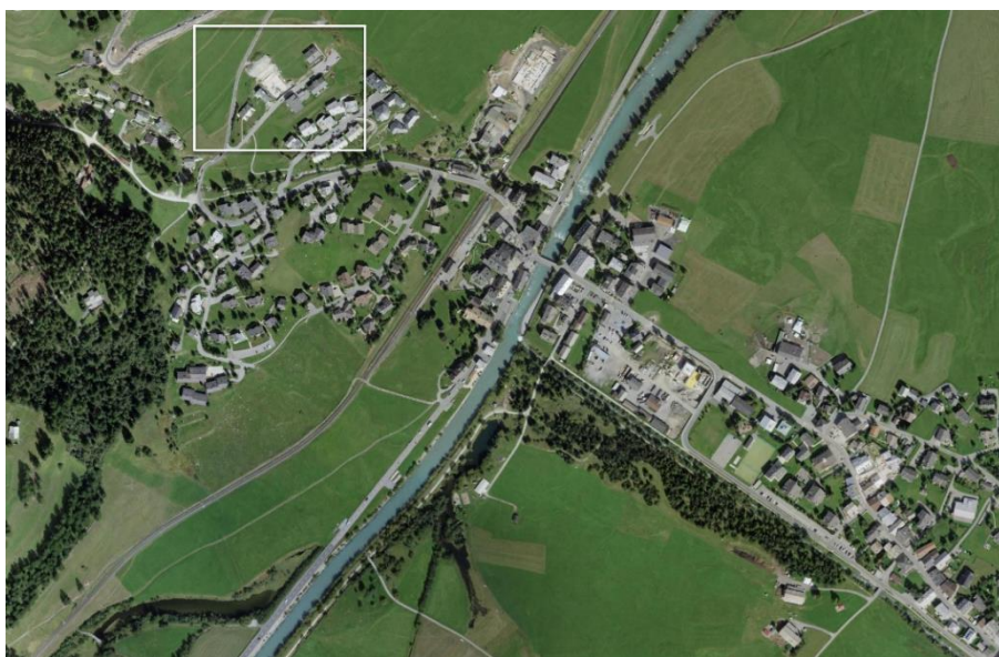
Abb. 1a: Gebiet Alvra Gemeinde La Punt Chamues-ch

Die Gemeinde La Punt Chamues-ch und die Bürgergemeinde sind Eigentümerinnen der Parzellen Nr. 484 (Bürgergemeinde) und der Parzellen Nr. 485 (Politische Gemeinde La Punt Chamues-ch) im Gebiet Alvra in La Punt Chamues-ch. Für das Gebiet Alvra besteht ein Quartierplan aus dem Jahre 2002. Verschiedene Parzellen sind seitdem nach den Bestimmungen des Quartierplans erstellt worden. Erst zu Teilen bebaut sind die beiden Parzellen Nr. 484 und 485.