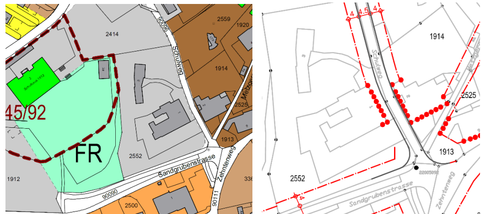
Abbildung 2: Ausschnitt aus dem Bauzonenplan (links) und Baulinienplan (rechts) Lostorf

Das Grundstück ist der Zone für öffentliche Bauten und Anlagen ein- bis dreigeschossig zugeordnet (§13 Zonenreglement). Diese Zone ist für öffentliche und öffentlichen Zwecken dienende Bauten und Anlagen bestimmt. Zulässig sind ein- bis drei Geschosse mit einer maximalen Gebäudehöhe von 9.00m. Das Gebäudeensemble rund um den Zehntenplatz ist im rechtsverbindlichen Zonenplan der Gemeinde Lostorf mit Pflichtbaulinien gesichert. Diese definieren die Lage künftiger Gebäude oder signalisieren die Überprüfung der Bestandsvolumen.