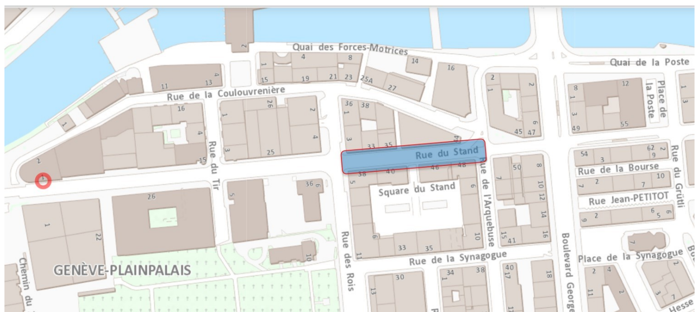
Figure 1 : Périmètre d'étude

Le périmètre se situe rue du Stand entre la rue des Rois et rue de l'Arquebuse selon la figure ci-dessous.