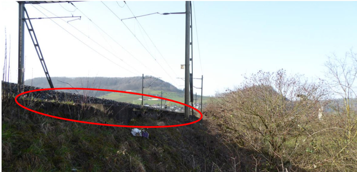
Abbildung 7 Bestandsfoto vom Dammschnitt 5 vom 26.02.2021 mit Sicht auf frei liegenden Kabelkanal in rot