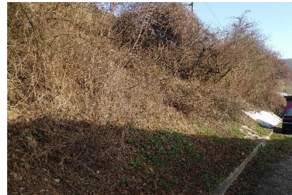
Abbildung 9 Bestandsfoto vom Dammschnitt 7 mit Blick Richtung Osten (links und rechts)