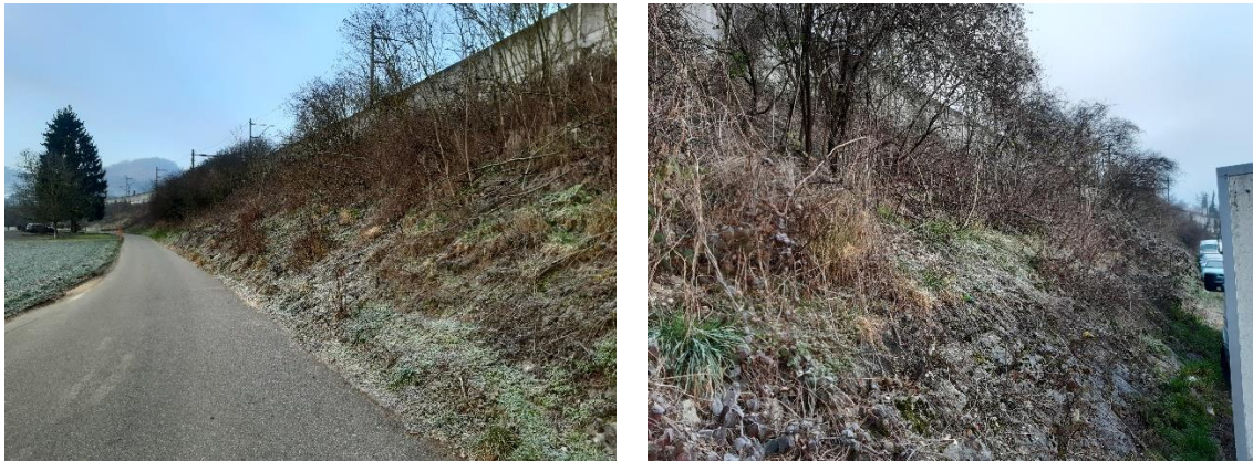
Abbildung 4 Bestandsfoto vom Dammabschnitt 4 mit Blick Richtung Westen (links) und Osten (rechts)