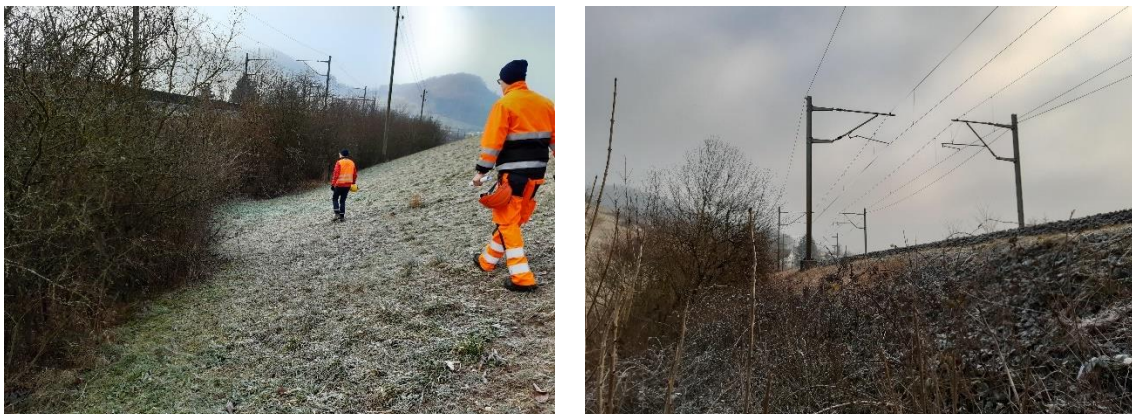
Abbildung 6 Bestandsfoto vom Dammabschnitt 5 mit Blick Richtung Westen (links) und Osten (rechts)