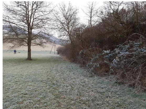
Abbildung 8 Bestandsfoto vom Dammschnitt 6 mit Blick Richtung Westen (links) und Osten (rechts)