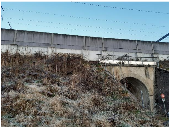
Abbildung 2 Bestandsbilder Dammabschnitt 1 mit Blick in Richtung Norden