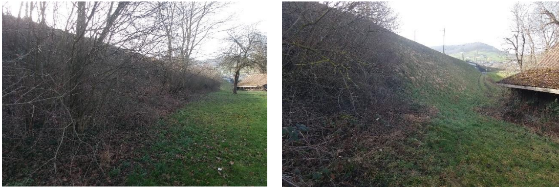
Abbildung 10 Bestandsfoto vom Dammabschnitt 7 mit Blick Richtung Westen (links und rechts)