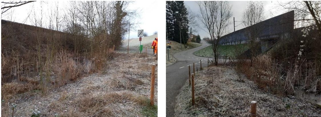
Abbildung 5 Bestandsfoto vom Dammabschnitt 5 mit Blick Richtung Westen (links) und Osten (rechts)