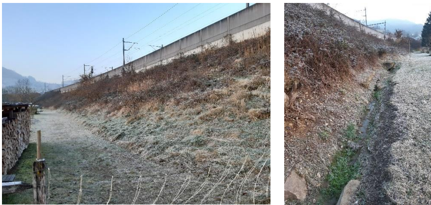
Abbildung 3 Dammabschnitt 2 mit Blick Richtung Westen (links) und Osten (rechts)