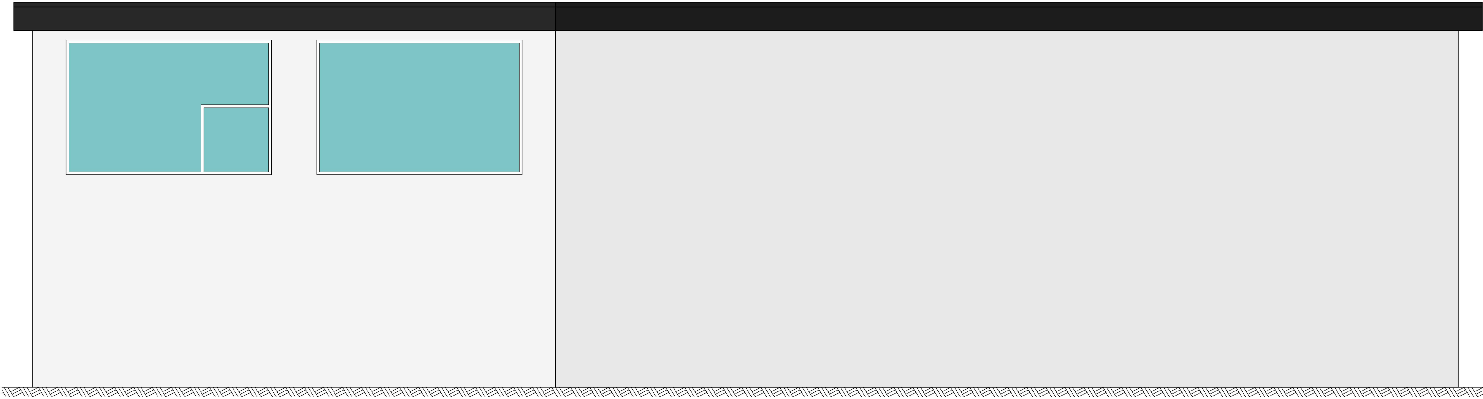
Ansicht Fassade 2 1:25