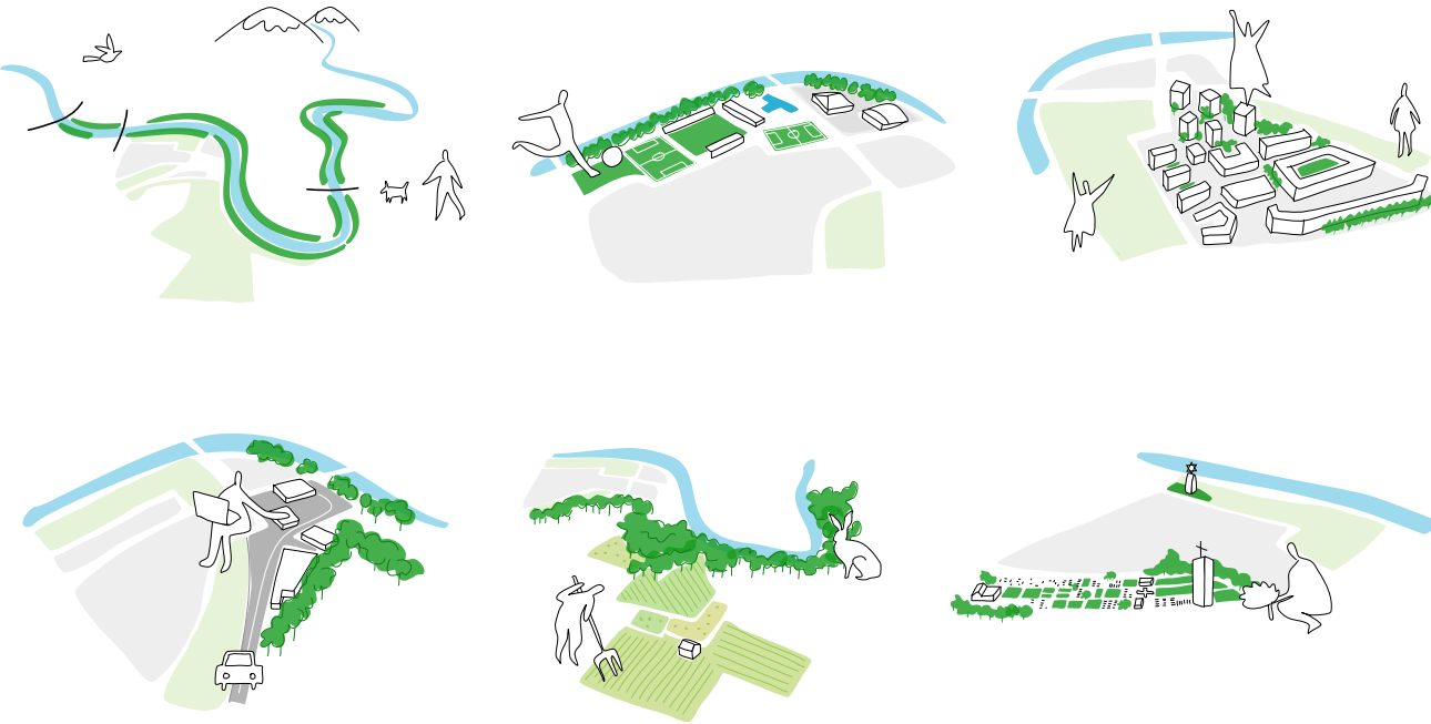
Diagramm: Die sechs Sektoren des Quartier la Fontenette