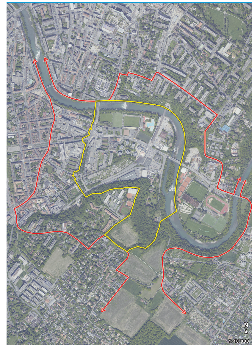
Projektperimeter (gelb) und Untersuchungsperimeter (rot)