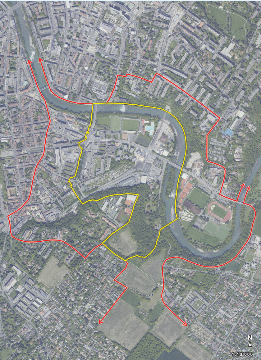
Périmètre de projet (jaune) et périmètre de réflexion (rouge)