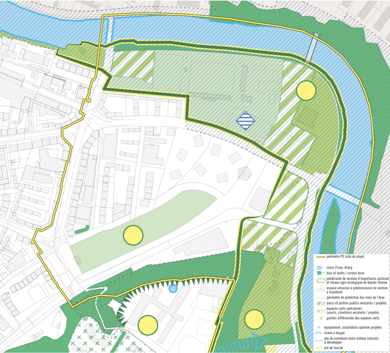
Projektperimeter : Natürliche und naturnahe Räume