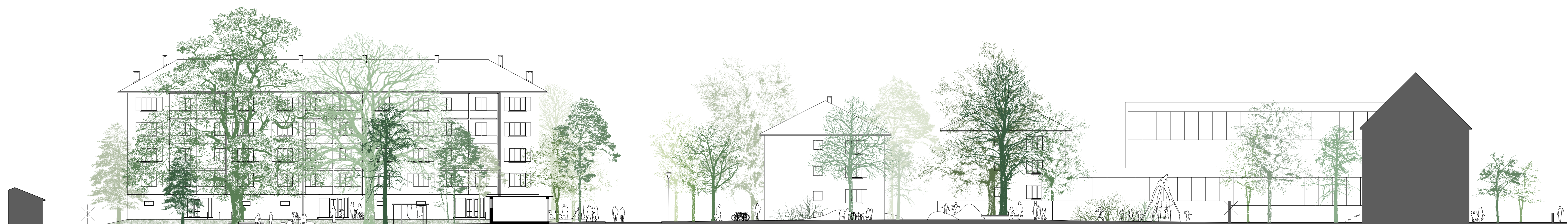
Schnittansicht B 1/200