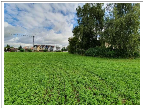
Abbildung 2 Wiese Nord, Richtung Schachenstrasse