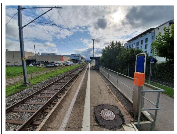
Abbildung 6 Bhf Blumenau Richtung Schmerikon