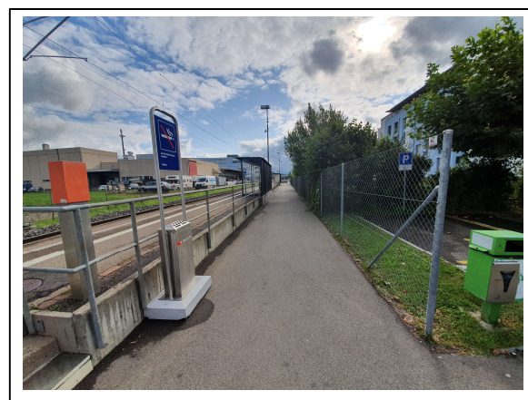
Abbildung 7 Fuss-Radweg Richtung Schmerikon