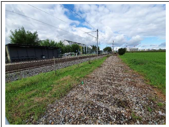
Abbildung 4 Wiese Nord, Richtung Rapperswil