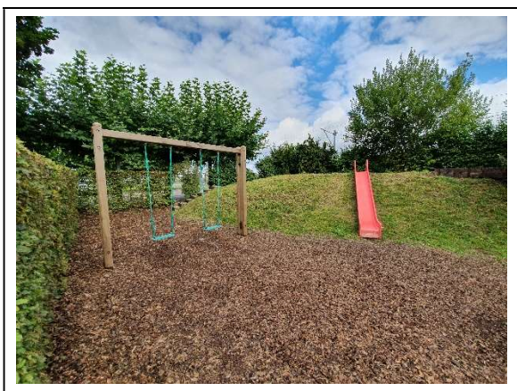
Abbildung 8 Spielplatz Süd