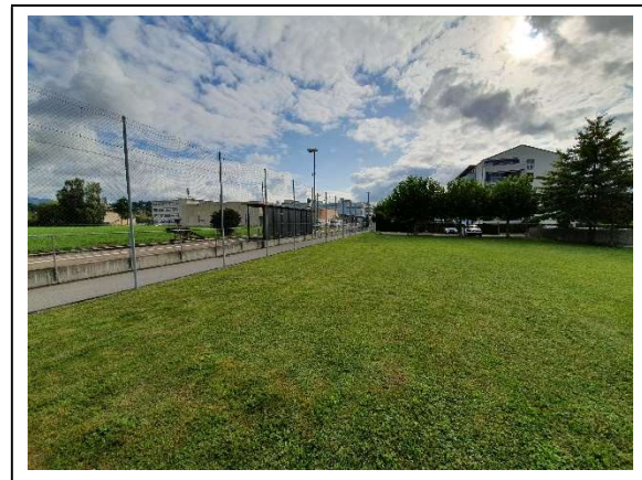
Abbildung 5 Wiese Süd, Richtung Bhf Blumenau