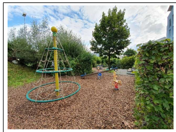
Abbildung 9 Spielplatz Süd