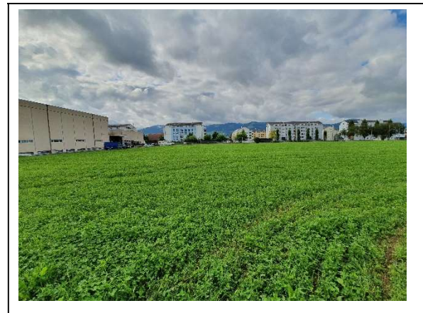
Abbildung 3 Wiese Nord, Richtung Bhf Blumenau